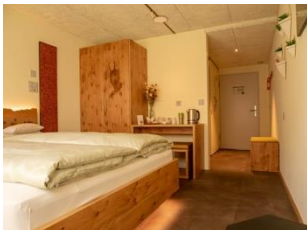
Future Hotelier Lab Room