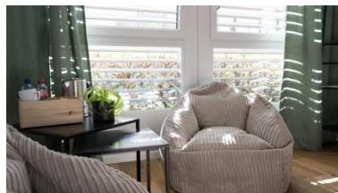
Lab Room Friends