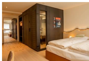
Swissness Lab Room