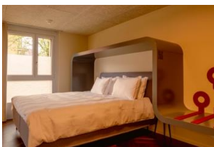
Smart Lab Room