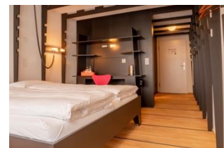
Upcycling Lab Room