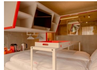
Modular Lab Room